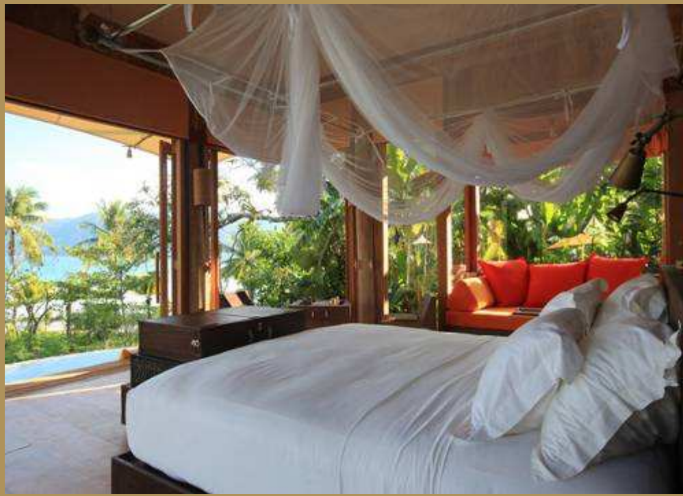
Soneva Kiri Beach Villa Suite