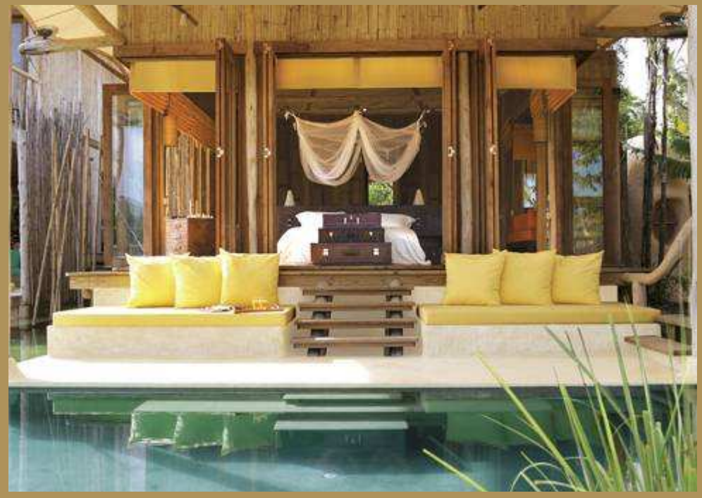
Soneva Kiri Hill Villa Suite