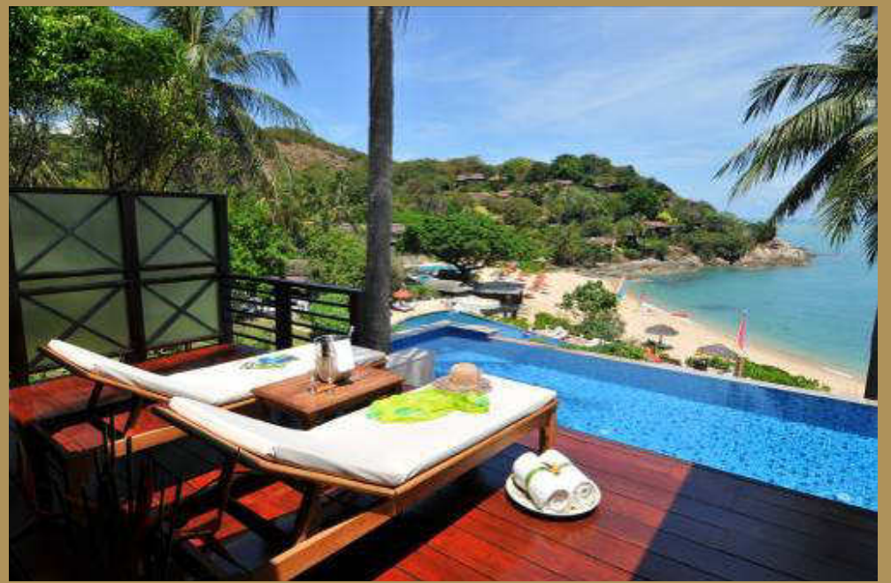
Tongsai Seafront Pool Villa