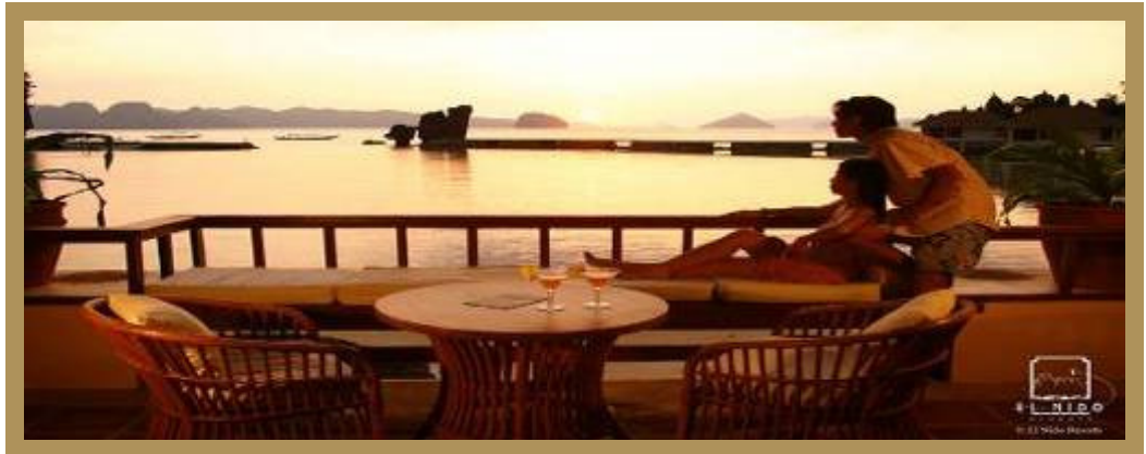
Veranda eines Strand-Bungalows

Zu den weiteren Einrichtungen des EL NIDO LAGEN RESORT gehören Rezeption, Lobby, Restaurant, Boutique, Gästesafes an der Rezeption, medizinische Versorgung (Hotelarzt), ein schön angelegter Swimmingpool mit Poolbar und Wassersportzentrum.