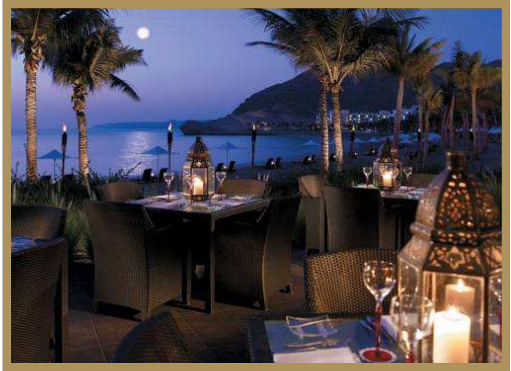
Capri Court Restaurant