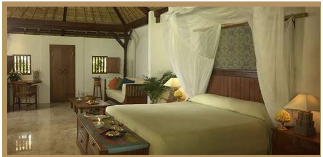
Superior Gaden View Cottage

Darüber hinaus sind alle Gästezimmer natürlich mit dem modernen Komfort, den Sie von einem Pansea Orient-Express Hotel erwarten können, ausgestattet, wie individuell regulierbarer Klimaanlage, Badezimmer mit Badewanne/Dusche/WC und zwei separaten Waschbecken, Haartrockner, 32 Zoll Faltescreen-Satelliten-TV, DVD-Player, internationales Direktwahltelefon sowie Minibar, Kühlschrank und elektronischer Zimmersafe.