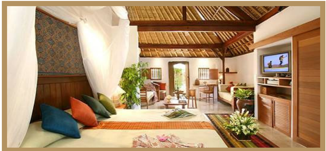
Garden View Cottage Suite

Darüber hinaus sind alle Gästezimmer natürlich mit dem modernen Komfort, den Sie von einem Pansea Orient-Express Hotel erwarten können, ausgestattet, wie individuell regulierbarer Klimaanlage, Badezimmer mit Badewanne/Dusche/WC und zwei separaten Waschbecken, Haartrockner, 32 Zoll Faltescreen-Satelliten-TV, DVD-Player, internationales Direktwahltelefon sowie Minibar, Kühlschrank und elektronischer Zimmersafe.